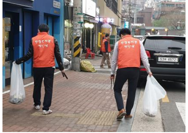
삼성SDS 제일기획 청소봉사